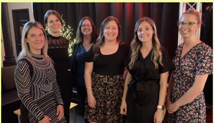
Équipe du service des bouchées

Nous tenons à remercier du fond du cœur toutes les personnes qui ont contribué à cette réussite en espérant qu'elles seront à nouveau des nôtres lors de la prochaine édition.