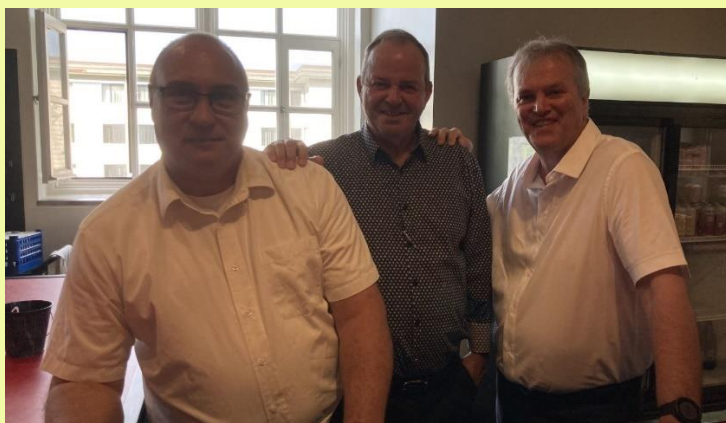
Équipe du service du bar