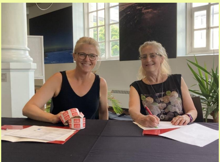
Équipe de l'accueil des convives