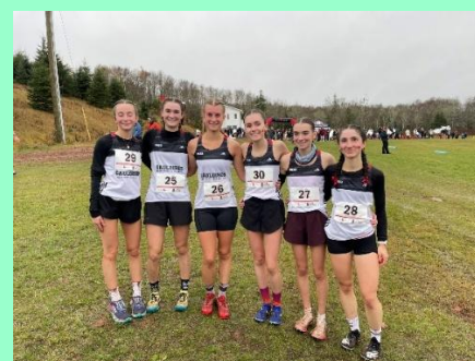
Les participantes du cross-country au championnat canadien