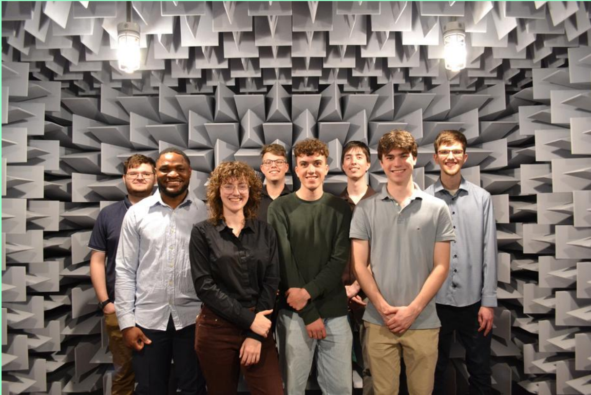
Participants 2026 au challenge de mesure physique

Grâce à la grande générosité des personnes et à une belle collaboration Fondation – Gaulois de l'Itaq et du Cégep de La Pocatière, la nouvelle formule de vente de moitié-moitié électronique a rapporté un grand total net de 4 432, 57 $ dont la moitié sera versée aux Gaulois pour les supporter dans leurs activités. La grande générosité de certains gagnants qui ont remis une part de leurs gains à la Fondation lui a permis d'ajouter un montant de 975 $ à sa campagne annuelle de financement. Nous les en remercions du fond du cœur.