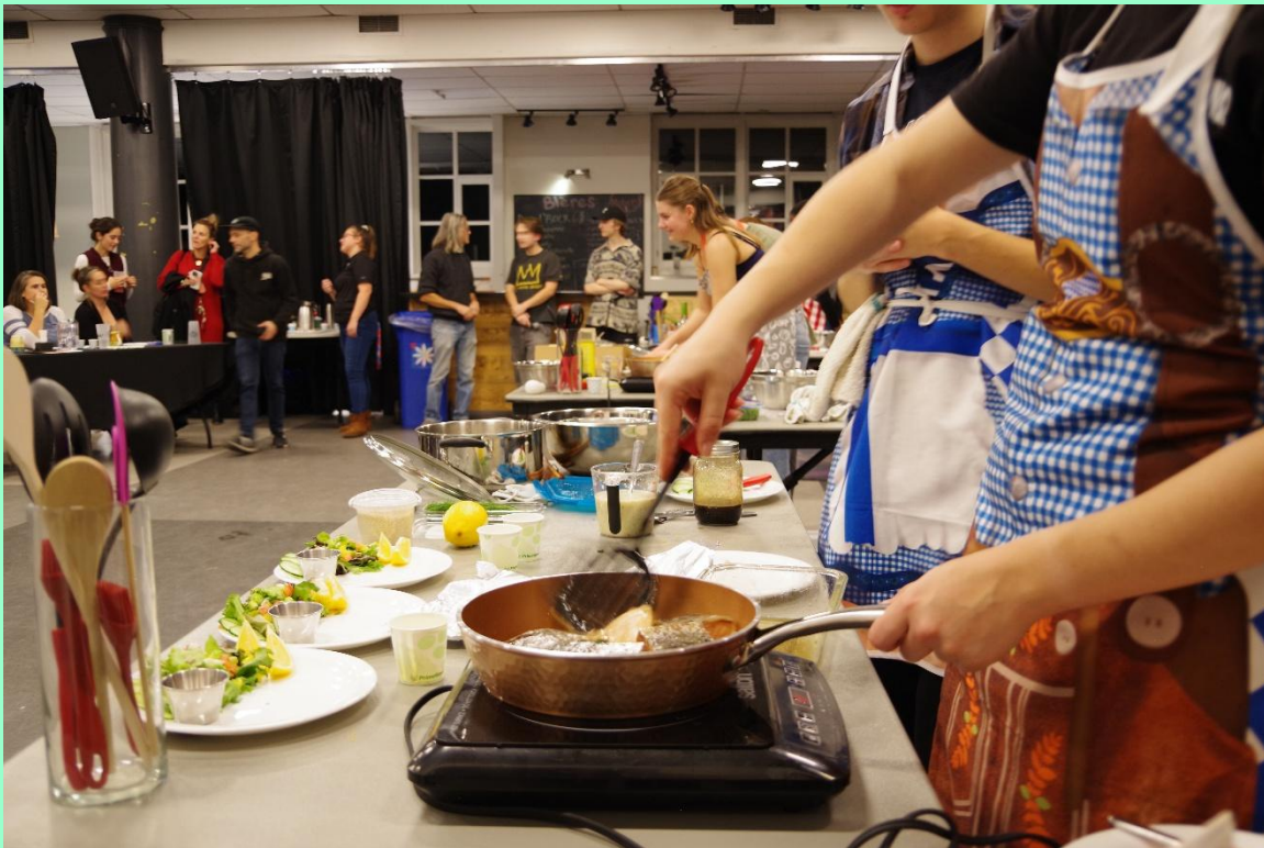
Participants en action au concours Moi, je cuisine !