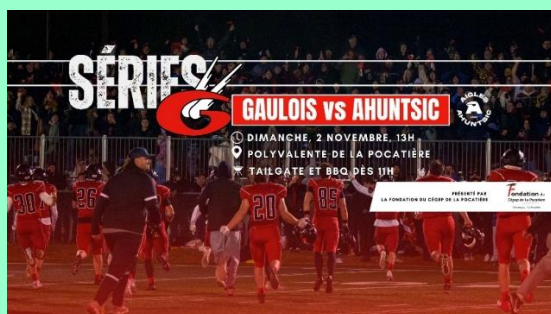
Affiche des quarts de finale des Gaulois