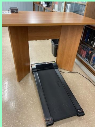
Tapis roulant studieux