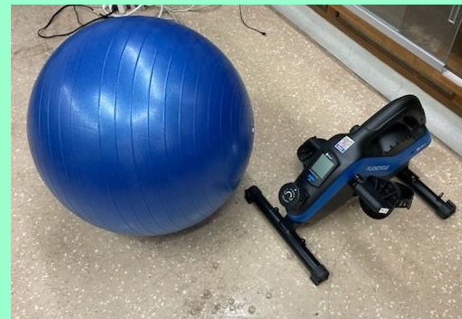
Ballon et pédalier

Autres dons et commandites – grand total : 9 000 $